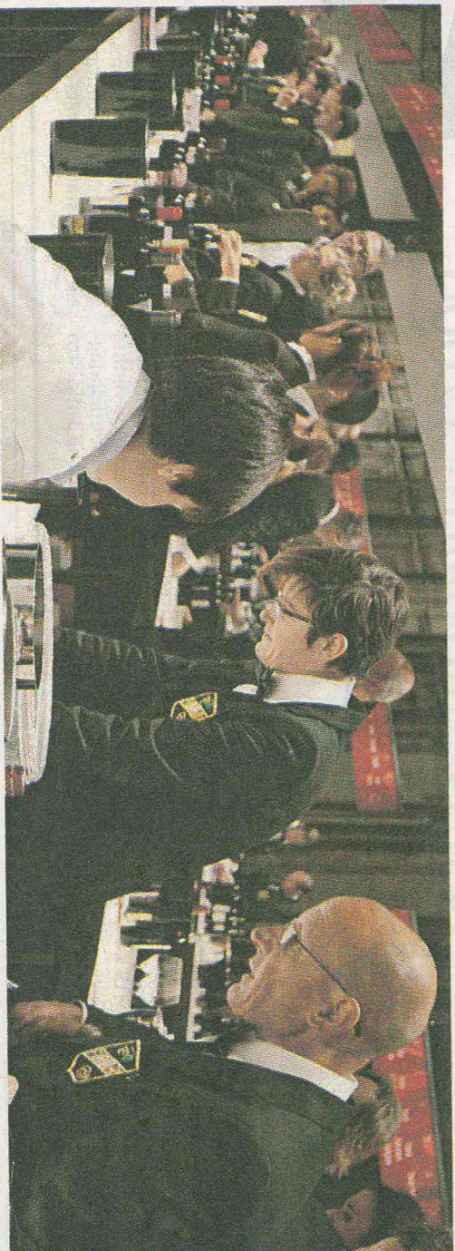
La presentazione della Guida Espresso dei vini alla Leopolda

Presentata la Guida de l'Espresso: in testa sempre Pinchiotto Classifica ristoranti, la sorpresa arriva al dolce