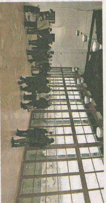
La spettacolare athena di Palazzo Strozzi dove ha sede il Sum